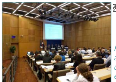
Participation du CNIDEP à la Rencontre nationale de l'Innovation et du commerce de proximité

© Le bulletin d'information du CNIDEP Centre National d'Innovation pour le Développement Durable et l'Environnement dans les Petites entreprises