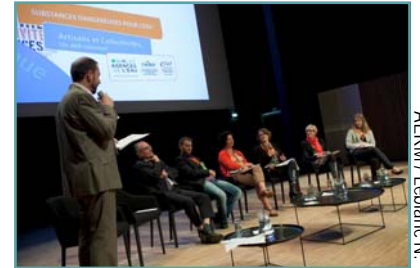
AERM / Leblanc N

s'inscrire en amont. La programmation des ateliers visait à balayer largement la problématique, en allant de la définition d'une substance dangereuse aux retours d'expériences de travaux déjà menés en faveur de la diminution des rejets dangereux dans l'eau. Pour finir, une demi-journée de plénière de conclusion a été proposée, afin de faire un retour sur l'ensemble des ateliers et de conclure l'événement sur des pistes d'actions futures.